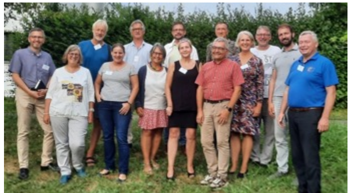
Regionalgruppe Südeuropa und östliches Mittelmeer auf der APK

Vom 16. – 21. August fand die Auslandspfarrkonferenz (APK) der Evangelischen Kirche in Deutschland in Bad Boll bei Stuttgart statt. Zur APK gehören alle Pfarrerinnen und Pfarrer, die in mit der EKD verbundenen Auslandsgemeinden tätig sind. Fünf Tage waren wir zusammen, haben in Vorträgen, Diskussionsrunden, Workshops und Regionalrunden unsere Arbeit reflektiert und uns damit beschäftigt, wie Kirche heute auftrags- und zeitgemäß mit den Menschen fern der Heimat oder in der neuen Heimat gestaltet werden kann. Und natürlich feierten wir regelmäßig Andachten und jeweils einen sehr schönen und berührenden Anfangs- und Abschlussgottesdienst.