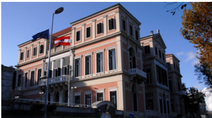
Österreichischen Kulturforum in Yeniköy