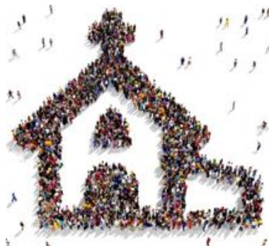
Grafik: jesus.de , Text: P. Härting

Wenn Sie sich vorstellen können, sich in einem dieser Punkte zu engagieren, dann sprechen Sie doch den Pastoralrat oder mich an. Wir haben stets aktuelle und konkrete Ideen für Engagement parat! Kontakt: mail@stpaul.de oder haerting@donbosco.de . Ich freue mich auf die Zusammenarbeit!